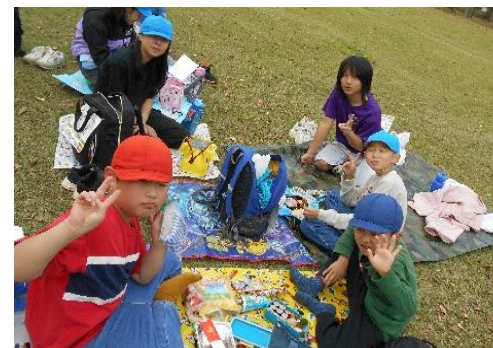
全校なかよし遠足