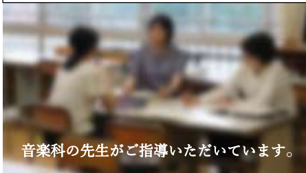
音楽科の先生がご指導いただいています。

この日、西部教育事務所、東松山市教育委員会より指導主事の方、また近隣の学校から校長先生など、多くの経験豊富な指導者の方にご来校いただきました。その後、先生方全員が授業を見ていただき指導者の方からご指導いただきました。南中の先生方は日頃から様々な方法を取り入れて授業をしていますが、この日は指導者の方から様々な指導方法や注意すべき点のご指導いただきました。先生方も勉強しています。