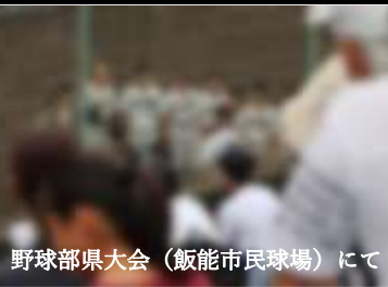
野球部県大会（飯能市民球場）にて

1学期末から8月初旬までの間に学校総合体育大会の本戦（県大会）が県内各地で開かれます。南中勢としては、7月12日（土）の野球部を皮切りに団体種目の9団体と個人戦出場者が県大会に出場します。上位入賞目指しての奮闘に期待しています。