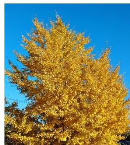
校舎西側の紅葉した銀杏の木

厳しい寒さが訪れる前に、柔らかな日差しの下で紅葉を楽しみながら「小春日和」を満喫したいものですが、紅葉を楽しむ間もなく一気に冬が訪れてしまうのでしょうか？寒さが日ごとに増してきます。お身体にお気を付けてお過ごしください。